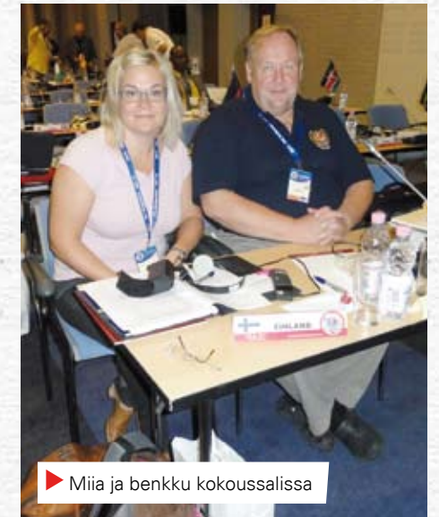
▶ Miia ja benkkü kokouksella

sekä budjetista vuodelle 2012. Kansainvälinen jäsenmaksu, minkä myös IPA SO maksaa jokaisesta jäsenestä, pysyy samana.