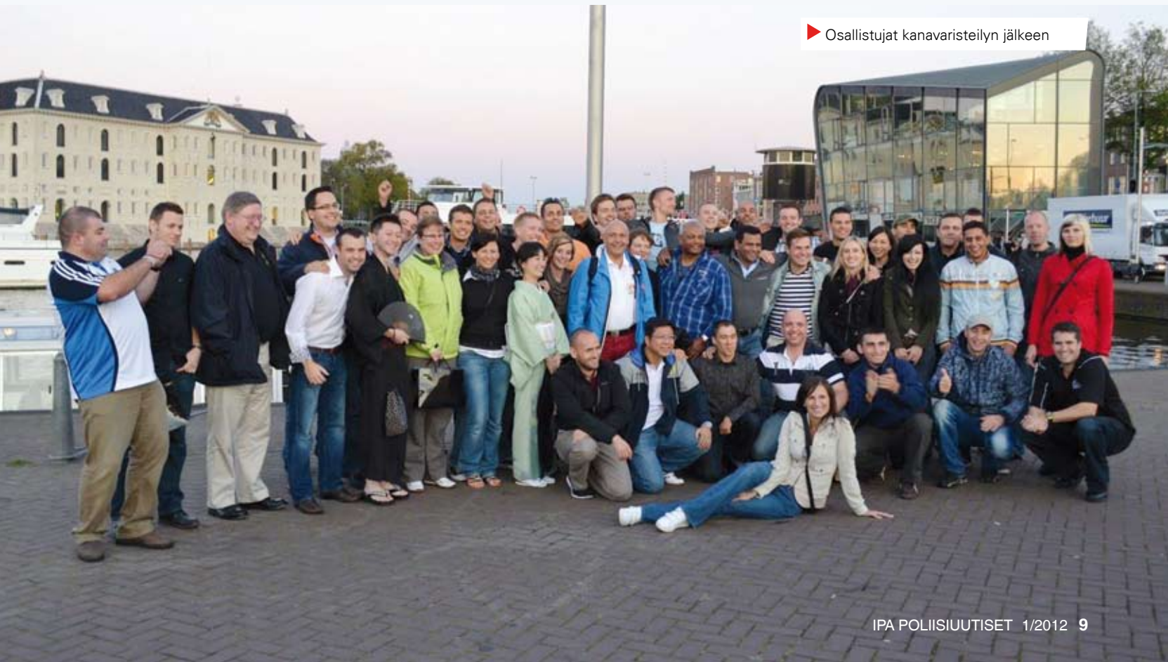
► Osallistujat kanavaristeilyn jälkeen

Paluumatka sujui yhtä hyvin kuin koko viikkokin. Voimme vain kiittää tätä hienoa järjestöä Suuren elämyksen tarjoamisesta sekä toivoa tulevilta reissuilta yhtä antoisia hetkiä. ■