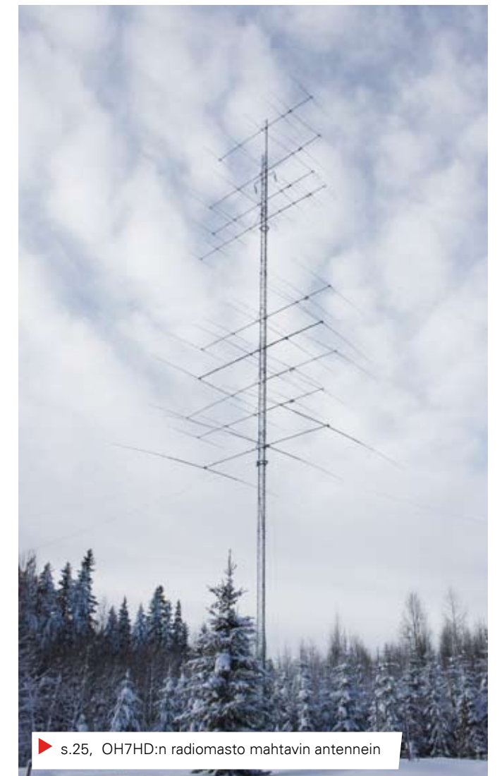
► s.25, OH7HD:n radiomasto mahtavin antennin