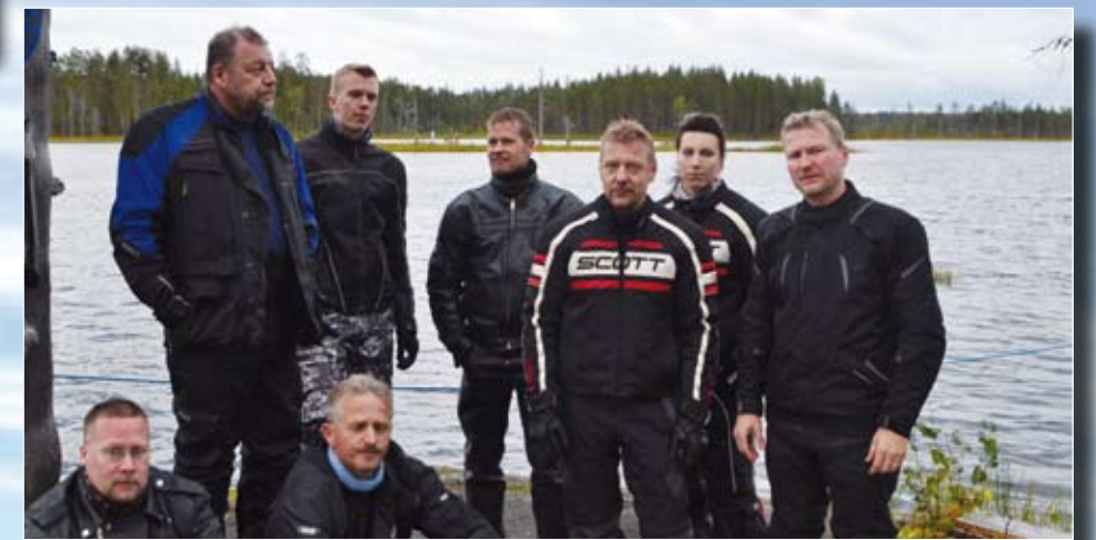
▶ Potretti EU:n itäisimmältä mannerpisteeltä, taustalla saarressa naapurusten rajapaalut.

Mahat kylläisinä retkeläiset hyppäsivät "prätkien-sä" selkään ja paluumatka takaisin kohti pääpoliisiasemaa alkoi. Jo alkumatkan aikana pimeys lankesi itäisen Suomen ylle. Pimeydestä huolimatta matka jatkui ilman kommelluksia. Matkaa kertyi reilut 300 kilometriä, joten olihan siinä yhdelle työpäivän jälkeiselle illalle ihan reilusti IPAkyttä. ■