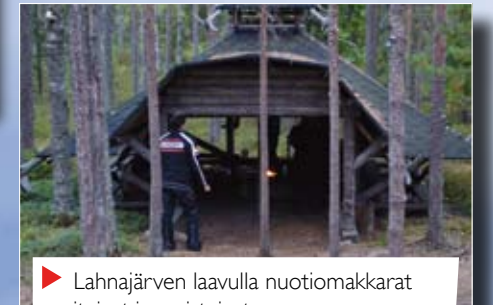
▶ Lahnajärven laavulla nuotiomakkarat pasituivat ja maistuivat

Aikamme lepuuteltuamme ajoimme muutaman kilometrin takaisin päin, pysähtyen makkara-paisto-operaatioon Lahnajärven kauniille laavulle. Ette uskokaan, miten hyvälle nuotiomakkarat tuossa vaiheessa ajoiltaa motoristien suussa maistuivat.