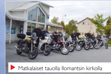
▶ Matkalaiset tauolla Ilomantsin kirkolla

V iime loppukesästä ajatus IPA- Karelian kesän toisesta IPA- ajosta pyöri mielessä ja niinpä sitten myöhemmällä syksyllä, elokuussa, IPA- "prätäkäläiset" kokoontuivat poliisilaitoksen pihalle. Kymmenen pyörää suuntasi kulkunsa kohti Suomen ja Euroopan Unionin mantereiden itäisintä pistettä. Ilomantsin kunnan Hattuvaaran kylässä, Virmajärvellä sijaitseva paikka on saarressa, jossa Suomen ja Venäjän valtakunnan raja tekee mutkan 54 astetta. Rajan ylimalkainen kulku muuttuu siellä koillisesta luoteeseen.