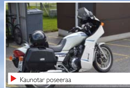
▶ Kaunotar poseeraa

Kahvittelujen jälkeen suuntasimme noin 50 km päässä oleva Hattuvaaran kylä. Kylähän on tullut kuuluisaksi aikanaan kovista sotataisteluistaan, mutta myös jokunen aika takaperin TV:ssäkin esitetystä jo vuosikymmeniä miljoonayleisöjä kotimaassaan keränneen saksalaisen Tötort-tv-sarjan yhdestä puolitoistatuntisesta jaksosta, joka kuvattiin lähes kokonaan Ilomantsin Hattuvaarassa. Muistanette tuon jakson nimeltään Borovskin tango.