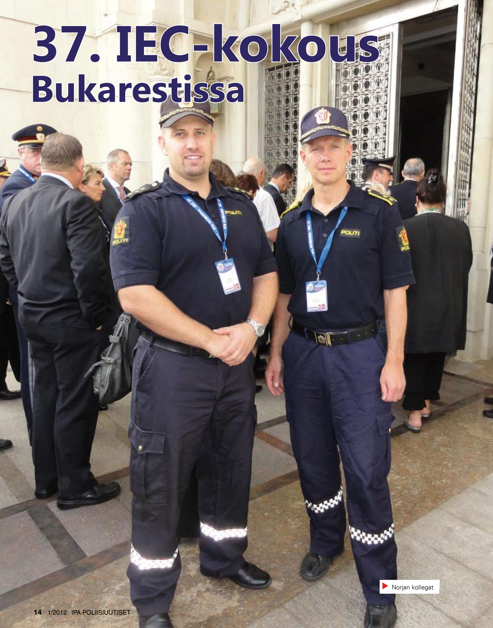
▶ Norjan kollegat