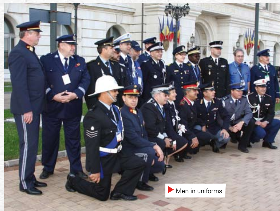
▶ Men in uniforms

37. IEC-kokous järjestettiin Romanian pääkaupungissa Bukarestissa 18 – 25.9.2011. Paikkana oli Rin Grand hotelli. Kokouksessa oli edustettuna seuraavat äänestysvaltaiset maat: Alankomaat, Andorra, Argentina, Australia, Botswana, Brasilia, Bulgaria, Espanja, Etelä-Afrikka, Gibraltar, Hongkong, Iranti, Islanti, Iso-Britannia, Israel, Italia, Japani, Kanada, Kenia, Kreikka, Kroatia, Kypros, Latvia, Lesotho, Liettua, Luxemburg, Malta, Mauritius, Moldova, Monaco, Mosambik, Norja, Peru, Portugal, Puola, Ranska, Romania, Ruotsi, Saksa, San Marino, Slovakia, Slovenia, Sri Lanka, Suomi, Sveitsi, Swazimaa, Tanska, Tšekki, Turkki, Ukraina, Unkari, Uusi-Seelanti, Venäjä, Viro ja Yhdysvallat. Kokouksessa olivat myös läsnä Bosnia ja Hertsegovinan ja Macaon edustajat statuksella ”section in foundation” eli he odottivat osaston virallistamista. Kokouksessa Moldova valittiin yksimielisesti uudeksi IPA maaksi.