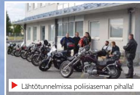
▶ Lähtötunnelmissa poliisiaseman pihalla!